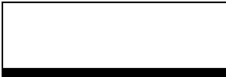
Unterschrift für den Führerschein ( mittig innerhalb des Rechtecks)